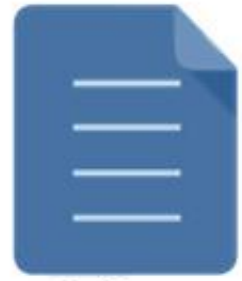
Согласие на обработку персональных данных