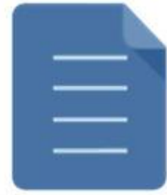
Договор на оказание платных образовательных услуг в сфере профессионального образования